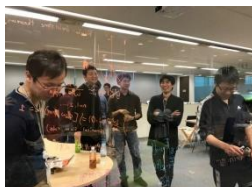
Arithmer 社内の議論の様子

Arithmer はこれまで OCR や静止画解析、動画解析、自然言語処理、3D モデル自動生成、スマートロボットなど AI を活用したソリューションサービスの研究・開発を行い、それを B2B にビジネス展開してきました。